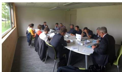
Un comité d'engagement RECA

Une fois l'accord du comité d'engagement, un « parrain » membre de RECA est désigné pour accompagner le porteur de projet sur les 3 premières années. Il rencontre régulièrement le nouvel entrepreneur ainsi que les autres Lauréats pour des moments de partages et d'échanges constructifs.